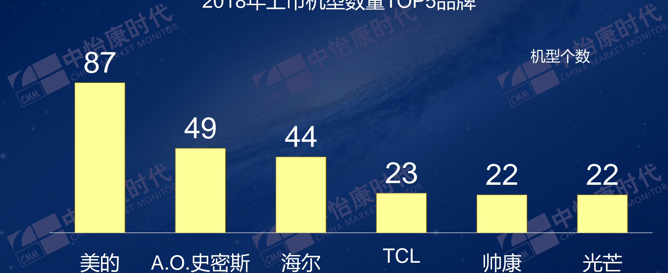
2018年上市机型数量TOP5品牌