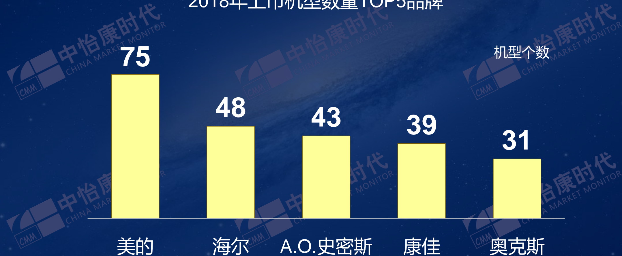
2018年上市机型数量TOP5品牌